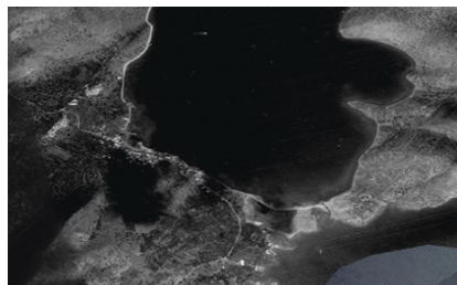
Ανάλυση Ιστορικών Αεροφωτογραφιών