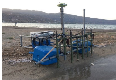
Γεωφυσική Έρευνα στον Πόρο της Ελούντας